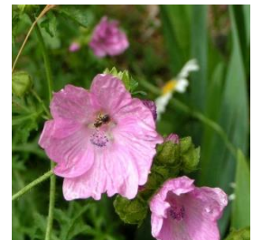
Foto: Moschus-Malve, FAL, commons.wikimedia.org/ w/index.php?curid=22533

Für ein klassisches nährstoffreiches Blumenbeet ist dieses Team optimal. Die heimischen Wildpflanzen wie Moschus-Malve und Große Pimpinelle kommen sowohl mit Sonne als auch Halbschatten klar. Außerdem sind sie mit ihren großen Blüten echte Hingucker und ziehen natürlich auch viele Insekten an.